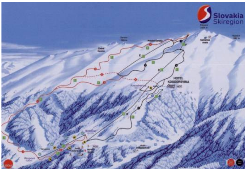
Chopok Juh (dinsdag)